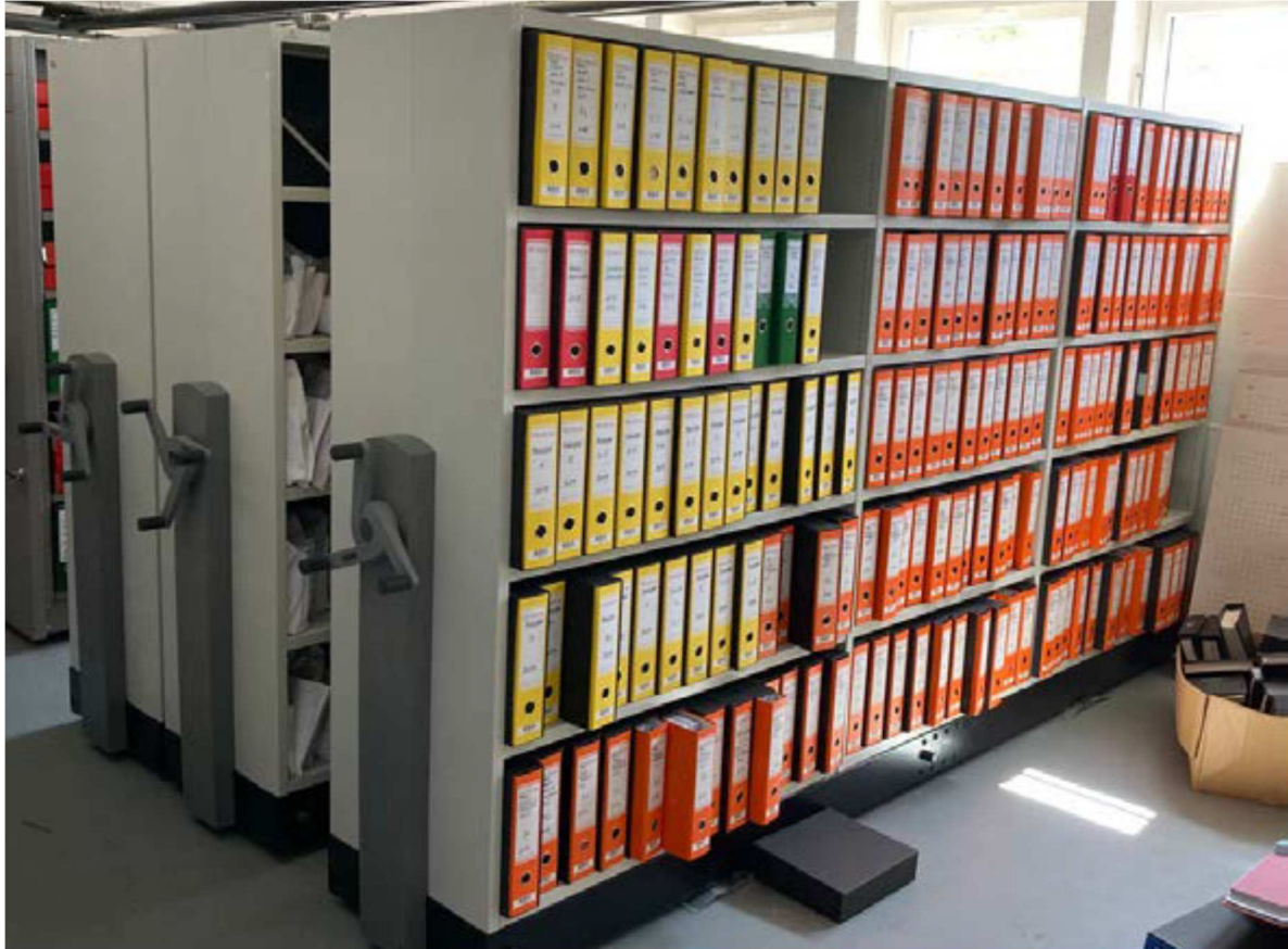
Predvidena postavitev v prostoru K11

3 x dvojni premični regal D3300 (2x1150+1x1000mm) G2x300, V cca 2200mm Dolžina tirnic 2700mm